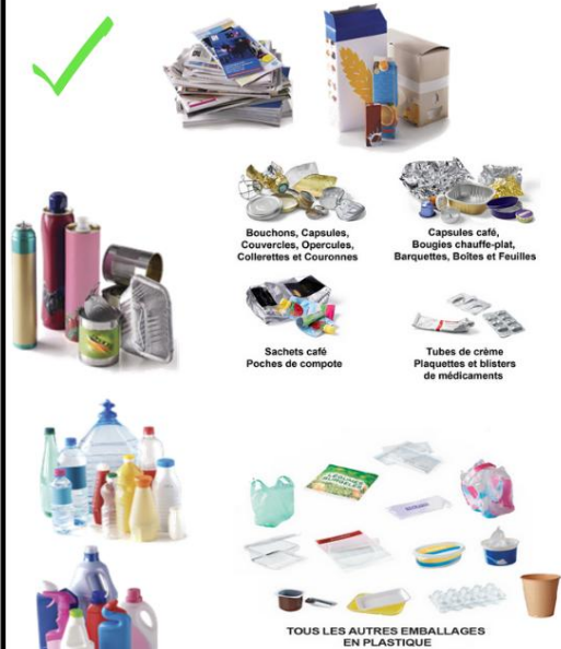
Bouchons, Capsules, Couverts, Opercules, Colerettes et Couronnes

aide au tri : www.citeo.com onglet guide du tri