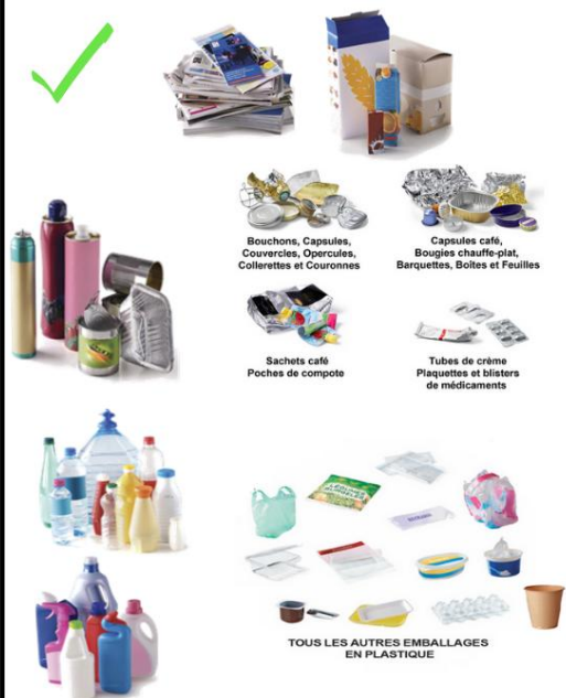
Bouchons, Capsules, Couverts, Opercules, Colerettes et Couronnes

aide au tri : www.citeo.com onglet guide du tri