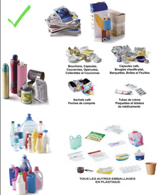
Bouchons, Capsules, Couverts, Opércules, Collerettes et Couronnes

aide au tri : www.citeo.com onglet guide du tri