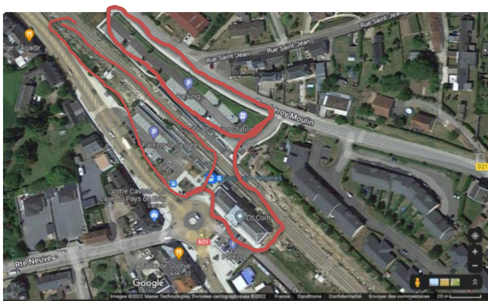
Google maps : PEM Gare Gournay en Bray / Ferrières en Bray

Particulièrement sur ce site occupé et en centre-ville, il est recommandé une phase de repérage, pour bien cadrer le travail et régler les difficultés en amont. Un balisage des zones d'intervention est à prévoir et une signalétique sera nécessaire afin de garantir la sécurité et l'optimisation des interventions.