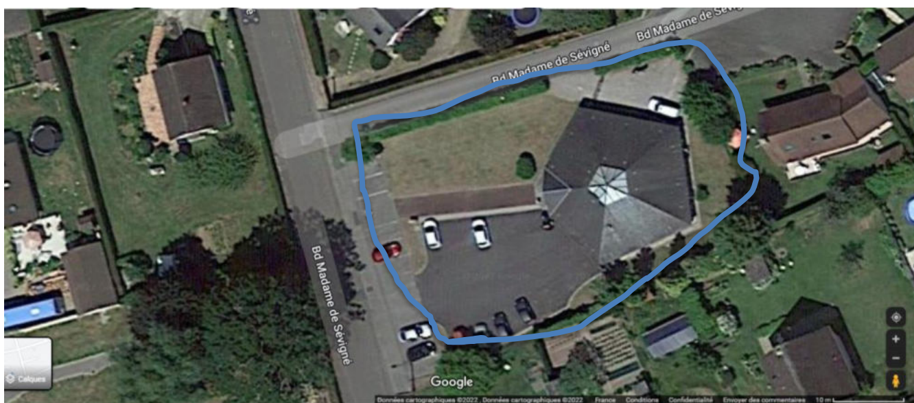
Google Maaps : 25 boulevard Madame de Sévigné – Forges les Eaux.

Une haie de charmille d'une vingtaine de mètres, est à entretenir une fois pendant la saison.