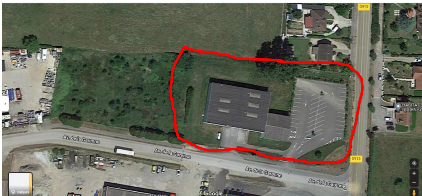
Google maps : Espace communautaire – ZA de la Garenne Gournay en Bray

Une fois dans la saison, taille de haies, arbres et arbustes présents sur le site.